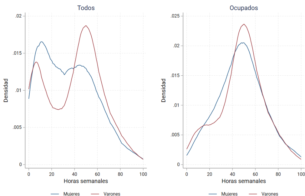
Gráfico 2. Distribución del tiempo de trabajo total por género

Filtro Epanechnikov con ancho de banda 5. Se eliminó el 1% superior de los datos para simplificar la lectura.