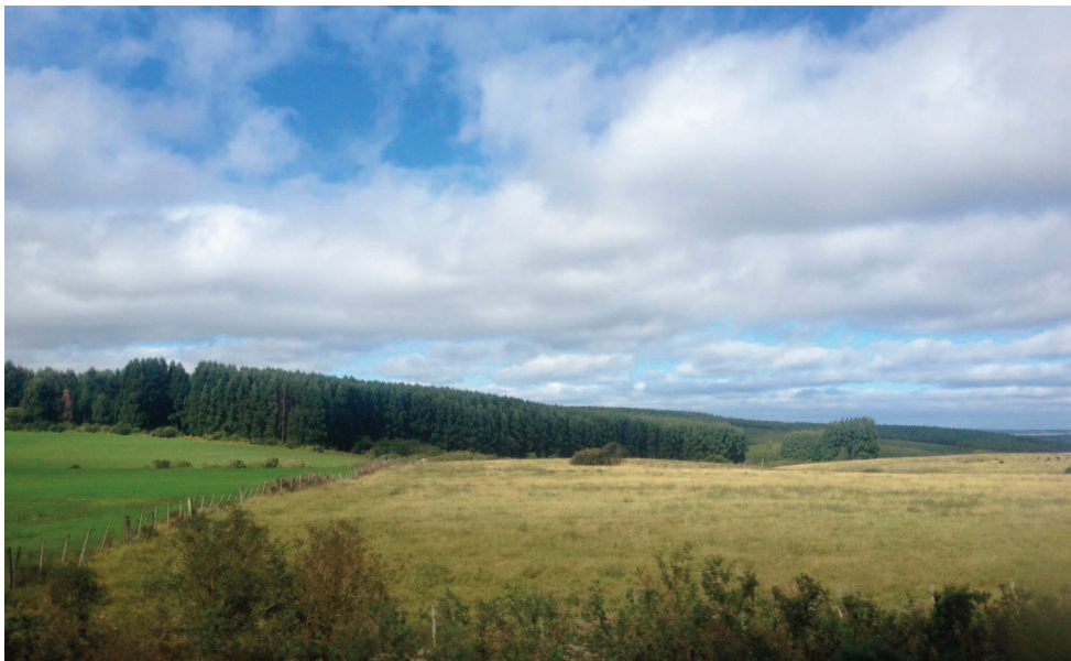
Figura 3: Florestamento com pinus nas imediações da rodovia BR-290, em São Gabriel (RS). Foto do Autor, 2016.

O emprego da metáfora da muralha para se referir ao efeito dos monocultivos sobre a paisagem pampeana é bastante significativo. Como vimos, esta é uma paisagem que se constituiu ao longo do tempo através do entrecruzamento de vários fluxos, que dão origem à uma cosmologia itinerante. Já a muralha é uma barreira que interrompe o fluxo, impede a circulação. Não precisamos pensar aqui somente desde o ponto de vista do encurralamento do gado em campos cada vez piores ou, como relata Bacchetta (2009), na estreita faixa de pastagem que sobra entre o alambrado e a estrada - fenômeno conhecido no Brasil como gado de corredor . O monocultivo florestal impõe também uma muralha aos próprios fluxos da biodiversidade nativa, já que suprime o campo natural e sua imensa variedade de espécies.