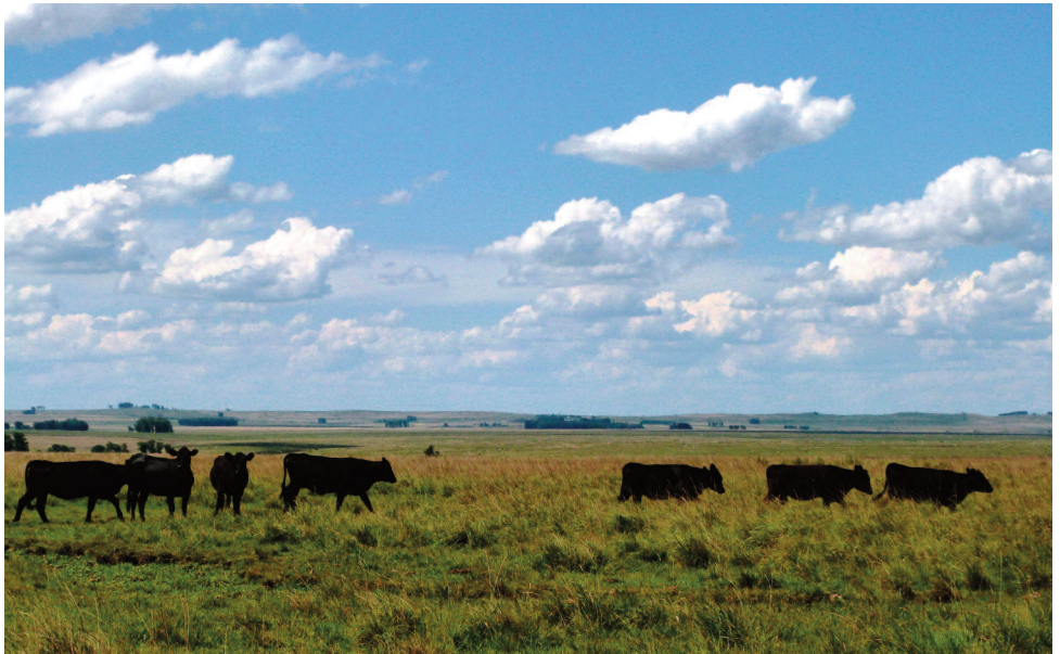
Figura 1: Paisagens típica da zona do basaltoem Rosário do Sul, distrito do Caverá (sup.), e Santana do Livramento, distrito do Espinilho (inf.).