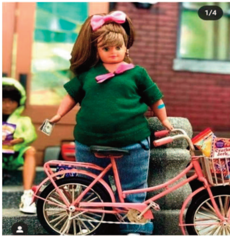
Imagen 1. Ideales de belleza y gordo-odio

Barbie Wtch 3 de septiembre de 2020 a las 18:38 · 🌐