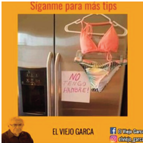
4 etapas de cuarentena.