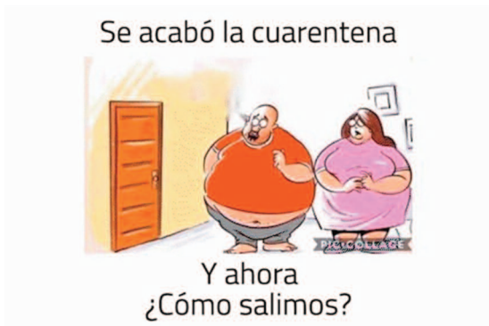
Imagen 3. La gordura como pánico moral

Primera salida de amigas después de la cuarentena 😂😂😂😂😂😂