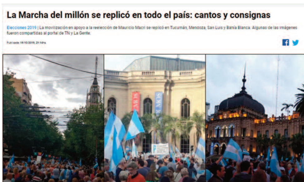
Imagen N°3. Nota publicada por TN correspondiente al tópico “Opinión Pública”