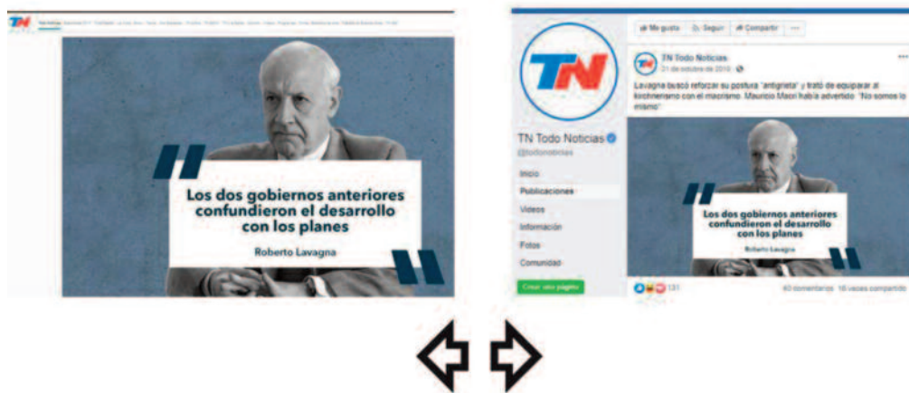
Imagen N°1. Fotografía creada por TN mediante intervención gráfica.

Fuente: elaboración propia en base a la publicación de TN.com.ar del 21 de octubre de 2019. Disponible en: https://tn.com.ar/politica/mira-en-vivo-el-debate-presidencial-en-tn-los-candidatos-se-cruzan-una-semana-de-las-elecciones_1004053