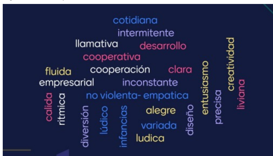
Figura 2. Nube de palabras obtenidas en la dinámica.