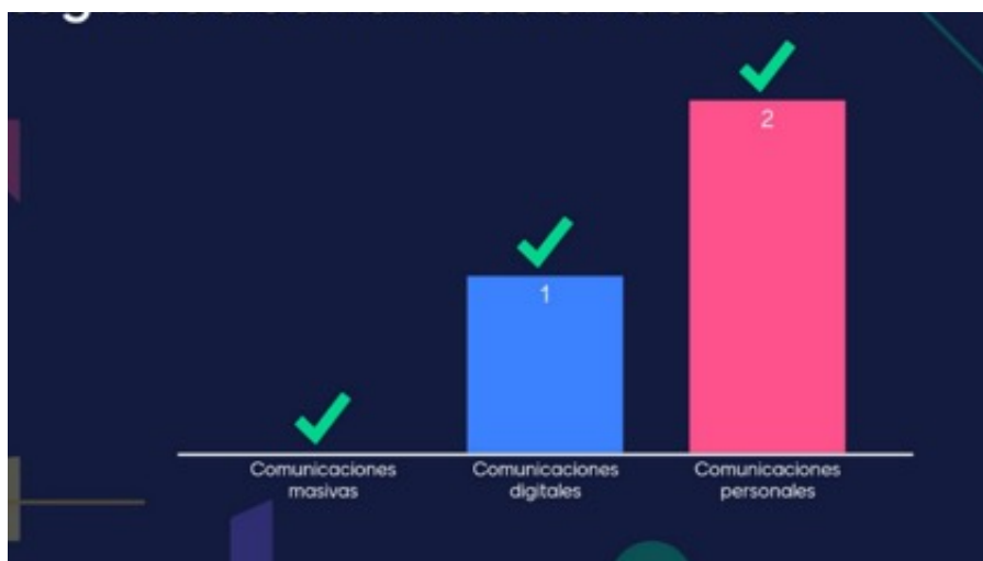
Figura 4. Resultados obtenidos de la dinámica.