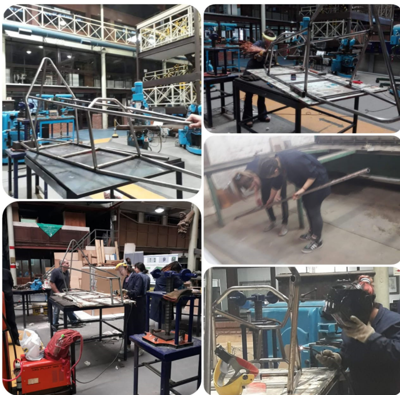
Imagen 1. Collage . Recargadas en el taller