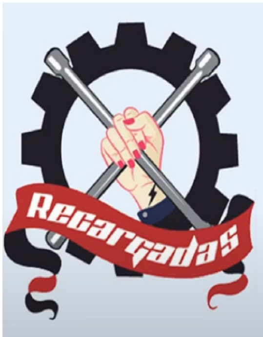
Imagen 2. Logotipo de Recargadas