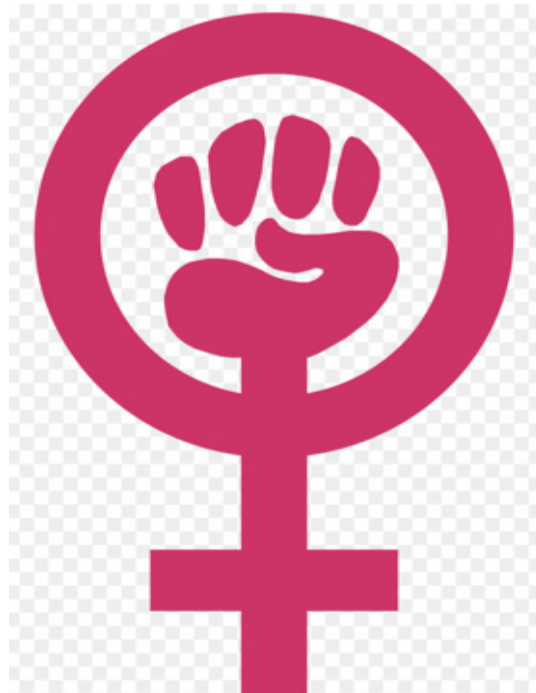
Imagen 3. Símbolo feminista