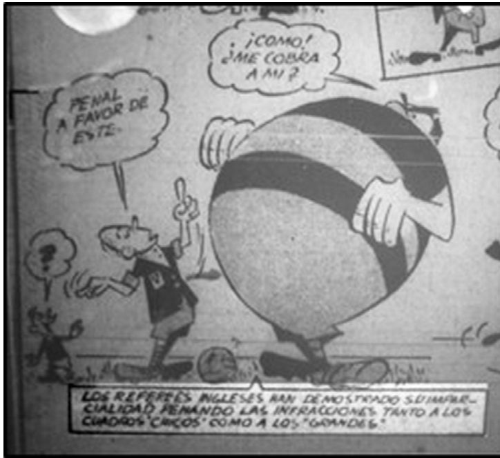
Imagen 2. Crítica , 5 de abril de 1948

Otra argumento que justificaba la importación de jueces británicos era la expurgación de las malas artes de los players locales, los que no solo estaban acostumbrados desde hacía décadas a las artimañas y picardías con las que buscaban obtener ventajas en la competencia futbolística, sino que, además, se mostraban particularmente renuentes a aceptar la autoridad de la figura del réferi, lo que producía los “bochornosos espectáculos” tan frecuentes de enfrentamientos verbales (y físicos) entre rivales y contra el propio árbitro. Se afirmaba que tales “vicios” eran el resultado de la adaptación de los referees argentinos al “medio” local, donde imperaba el “pasionismo” de jugadores y dirigentes, lo que terminaba torciendo las reglas a los “modismos” vernáculos. 38 La esperanza de que tales costumbres pudieran ser erradicadas a partir de la incorporación de jueces que en tanto británicos eran “escuela de disciplina” y en tanto extranjeros desconocían tanto el idioma como las “mañas” del ambiente criollo era una de las principales razones que alimentaba las expectativas por su llegada. 39