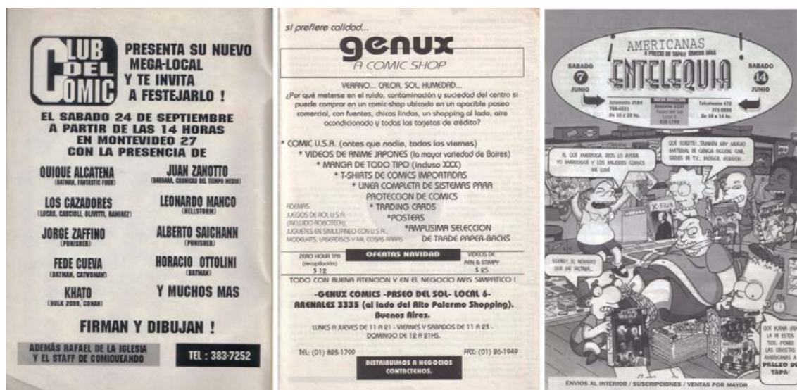
Imagen 1. Publicidad gráfica de El Club del Comic ( Comiqueando , nº 5, septiembre, 1994: 2), Genux ( Comiqueando , nº 8, diciembre, 1994: 15) y Entelequia ( Comiqueando , nº 27, mayo, 1997: 28)