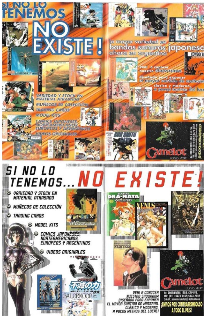
Imagen 4. Avisos a doble página de Camelot ( Lazer , nº 15, 24 de octubre, 1999: 30-31; nº 16, 14 de enero de 2000: 44-45)