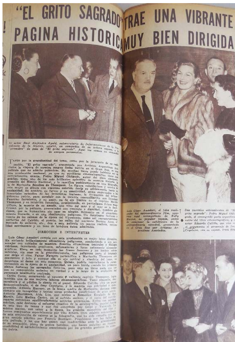
Imagen 7. "El grito sagrado trae una vibrante página histórica muy bien dirigida", Radiolandia , año XXIX, nº 1364, 5 de junio de 1954

Radiolandia anunció su estreno en junio de 1954 y le dedicó palabras de aliento a la película y a su director. En las imágenes, que habitualmente combinaban fotografías de las figuras del espectáculo que asistían a la premier y de los protagonistas del film, estaba llamativamente ausente Fanny Navarro. En la presentación, se los veía al subsecretario de Prensa y Difusión, Apold, y al director del film, Amadori, junto a su esposa y estrella del espectáculo Zully Moreno, pero no había fotos de ningún segmento de la película que mostrara a la protagonista del film. Sobre su desempeño, se afirmaba que “personifica a Mariquita Sánchez de Thompson con convicción y brío y, aunque ella es eje central y absoluto del tema, no desentona ni decae un solo momento”. 23 En su carácter de representante de Eva Perón en el mundo del espectáculo, El grito sagrado se nutría de su interpretación para lograr la evocación y reivindicación de una figura emblemática del justicialismo.