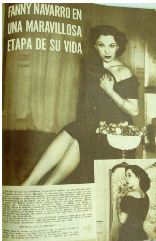
Imágenes 4 y 5. "Fanny Navarro en una maravillosa etapa de su vida", Radiolandia , año XXVI, 23 de septiembre de 1950

Bajo el título "Fanny Navarro en una maravillosa etapa de su vida", Radiolandia recorría, con el formato tradicional de entrevistas a las estrellas, su situación profesional y sentimental. Navarro describía a su madre y sus hermanas como las depositarias de su amor filial y, más allá de esta referencia, no se mencionaba ningún romance ni su casamiento y posterior divorcio. De esta manera, Fanny Navarro aspiraba a presentarse según el canon que correspondía a las estrellas, como una mujer de familia, aunque con una particularidad. El relato no recaía en su rol de esposa, como era habitual entre las actrices. Al contrario, aludía a su propia madre, en una referencia considerada adecuada para las figuras masculinas, pero no para las femeninas. Además, le dedicaba un apartado a su tarea al frente del Ateneo, en el que mencionaba a Eva Perón como primera dama, pero también como "consejera y amiga", lo que daba cuenta del vínculo afectivo y político que mantenían. 14