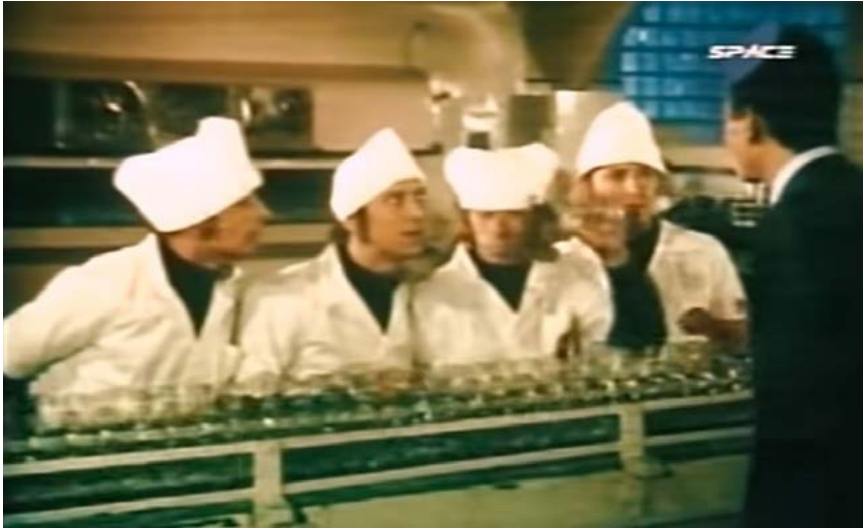
Imagen 1. Los Shakers actuando como trabajadores de la fábrica de Coca-Cola en la película Escala musical

¿Cuándo y cómo había comenzado a forjarse esta cadena de equivalencias entre la juventud argentina, la nueva música beat (y la música pop-rock en general), los flequillos de inspiración beatle y un cierto ethos o estado de ánimo rebelde (Pujol, 2002; Chastagner, 2012)? La respuesta a esta pregunta es crucial si el objetivo es ir más allá de la “certeza de que los años sesenta conmovieron los más variados planos de la vida personal y colectiva” (Cosse, 2010: 113) para intentar comprender los modos concretos en que esas transformaciones ocurrieron. En este sentido, el objetivo de este artículo es reconstruir un episodio clave de esta historia: el de la presentación de los Beatles al público argentino por parte de la industria discográfica y los medios de comunicación entre los años 1964 y 1966. Sobre la base del estudio de las ediciones locales de los diferentes discos de la banda, de las dos primeras películas del grupo ( A Hard Day's Night y Help! ) y de distintas publicaciones de la prensa gráfica, el trabajo busca describir y analizar la forma en que las grabaciones, las imágenes y otras informaciones de la banda conformada por John Lennon, Paul McCartney, George Harrison y Ringo Starr arribaron a la Argentina durante el primer momento de su proyección internacional, poniendo el foco en el rol de mediación cumplido por el sello discográfico Odeón y distintos medios de comunicación (revistas, radios, televisión, cine).