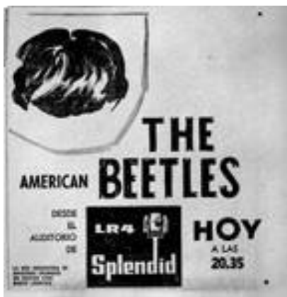
Imagen 6. Publicidad de la presentación de The American Beetles en Radio Splendid (1964)