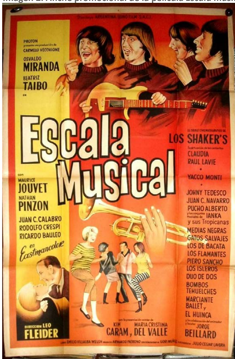
Imagen 2. Afiche promocional de la película Escala musical (1966).