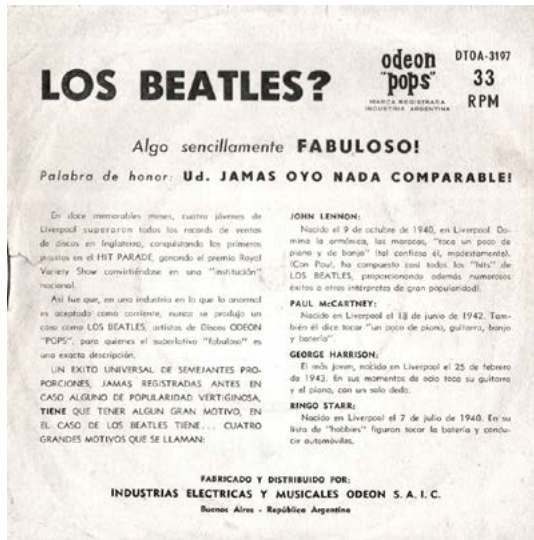
Imagen 4. Contratapa del simple de los Beatles que contenía “Twist y gritos” (“Twist and Shout”) y “La vi parada ahí” (“I Saw Her Standing There”), Odeon “pops”, nº 75.202, 1964

Que esta información ofrecida en las contratapas buscaba ofrecer un insumo para los vendedores y periodistas no es difícil de constatar. Otra parte del texto que aparecía junto al disco de 78 rpm también formaba parte, por ejemplo, de un folleto informativo que fue distribuido entre esos distintos agentes comerciales (quienes trabajaban en disquerías y quienes lo hacían en algún medio de prensa) como parte de la campaña de promoción de la primera gran tanda de grabaciones del grupo. Allí se exponía, como un dato significativo para comunicar al público, la visión de la propia industria discográfica sobre el carácter inédito del éxito comercial de este nuevo grupo que en apenas “doce memorables meses” habían superado “todos los récords de ventas de discos” (Chilabert et al. , 2002: 50).