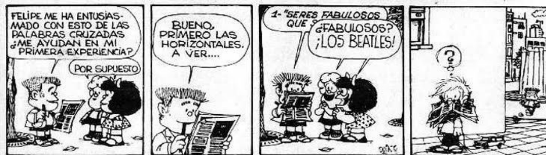
Imagen 5. Mafalda y los Beatles I.

la juventud”. 8 Sin embargo, en su descripción del grupo incluía exactamente la misma explicación del nombre que había hecho Clarín y repetía con rigor la información biográfica que había difundido Odeon. Lo mismo sucedía en una nota publicada apenas unos meses más tarde por la revista Claudia , en la que el redactor aseveraba, además, como si se hubiese inspirado directamente en la contratapa del simple de 78 rpm ya analizado, que los Beatles eran “fabulosos”. 9 La información estampada en los discos y difundida por la prensa evidentemente circulaba con fluidez: ese mismo adjetivo era el que Mafalda y Susanita, en una de las tantas viñetas con alusiones a los Beatles que el dibujante Quino publicó por entonces, gritaban con alegría para describir a su grupo musical favorito. 10 La presentación mediática del cuarteto británico participaba de modo directo en el veloz desarrollo de una beatlemania argentina.