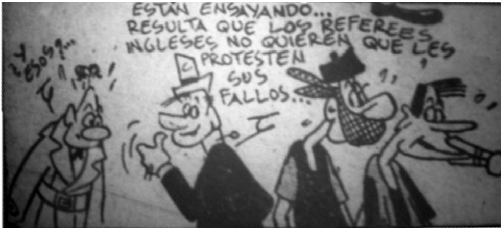
Imagen 4. Crítica , 11 de mayo de 1948

Similarmente, al comentar las duras sanciones recibidas por dos jugadores, Crítica rescataba su “espíritu ejemplificador” para lograr obtener “disciplina” en las canchas, moderando “las actitudes características de nuestros jugadores”. El bienvenido efecto de la “contribución de los árbitros británicos” parecía notorio, en la medida en que había sido la tolerancia de los jueces locales”, indiferentes ante las “protestas airadas”, “insultos” y “manoseos” de los jugadores, prácticas todas “perniciosas” para el deporte, lo que había generado la “falta de respeto al referee”. Acto seguido el editorialista ensaya una comparación que deja en evidencia el efecto modelador que se esperaba de la incorporación inglesa a nuestro fútbol: