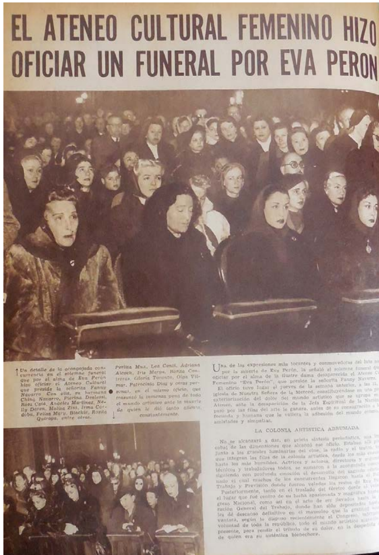
Imagen 6. "El Ateneo cultural femenino hizo oficial un funeral por Eva Perón", Radiolandia , año XXVII, nº 1270, 16 de agosto de 1952

La película tenía como objetivo recordar y reivindicar la obra de Eva Perón a través de una figura del pasado, que fue una de las primeras mujeres argentinas políticamente activas. No se recurrió a una película que contara la vida y la lucha de Eva Perón, que más adelante se convertiría en uno de las personalidades predilectas para el cine nacional y extranjero. Como afirma Clara Kriger (2009), el peronismo no recurrió en las películas de ficción a referencias políticas explícitas, en las que se expusieran los líderes justicialistas o el movimiento de masas. Con Eva fallecida, y bajo la dirección de Amadori, que había guionado y filmado sus funerales en el cortometraje producido por la Subsecretaría de Prensa y Difusión, Eva Perón Inmortal (1952), surgía el proyecto de dedicarle una película de ficción, pero evitando su protagonismo de forma directa.