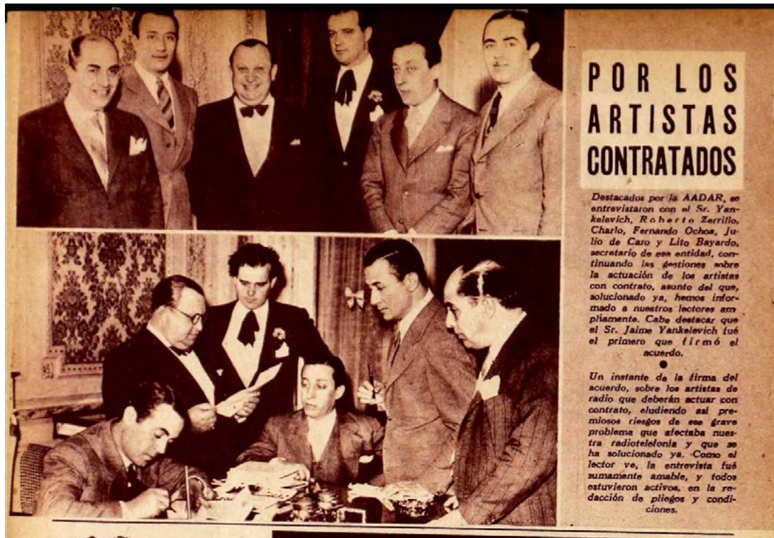
Imagen 1. Radiolandia , nº 666, 21/12/1940