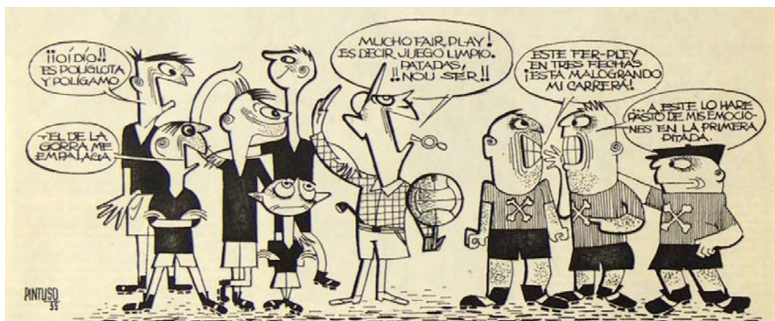
Imagen 3. Olimpia , 14, agosto de 1955

Si se esperaba que estos males fuesen paulatinamente desterrados gracias a la labor de los ingleses, es porque para muchos eran resultado de la perversión del noble espíritu de sportsmanship que trajo aparejada la popularización y profesionalización del fútbol. Así, la llegada de los árbitros británicos permitiría “encauzar” a los futbolistas hacia la recuperación de estos valores: