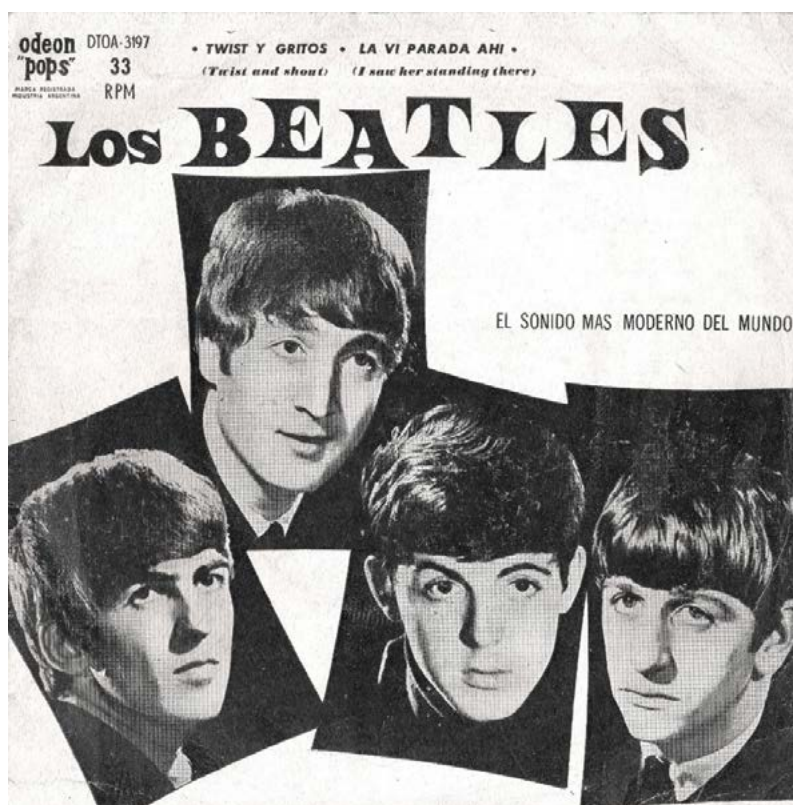
Imagen 3. Tapa del simple de los Beatles que contenía “Twist y gritos” (“Twist and Shout”) y “La vi parada ahí” (“I Saw Her Standing There”), Odeon “pops”, nº 75.202, 1964

El análisis de la contratapa de este mismo simple de 78 rpm puede ser igualmente útil e ilustrativo para conocer cómo fue presentado en términos más amplios el grupo en aquellos primeros años y saber de qué información general dispusieron sus oyentes argentinos. “ Los Beatles? Algo sencillamente fabuloso! Palabra de honor: Ud. jamás oyó nada comparable! ”, prometía el texto incluido en el reverso del sobre de aquel disco. Si bien el diseño tipográfico, con las palabras resaltadas en negrita, era especialmente publicitario en este caso, este tipo de presentación en donde el texto y la argumentación ocupaban un lugar central se repetiría en la gran mayoría de los discos de la banda que fueron lanzados en el país entre 1964 y comienzos de 1966. En este punto, la llegada de los