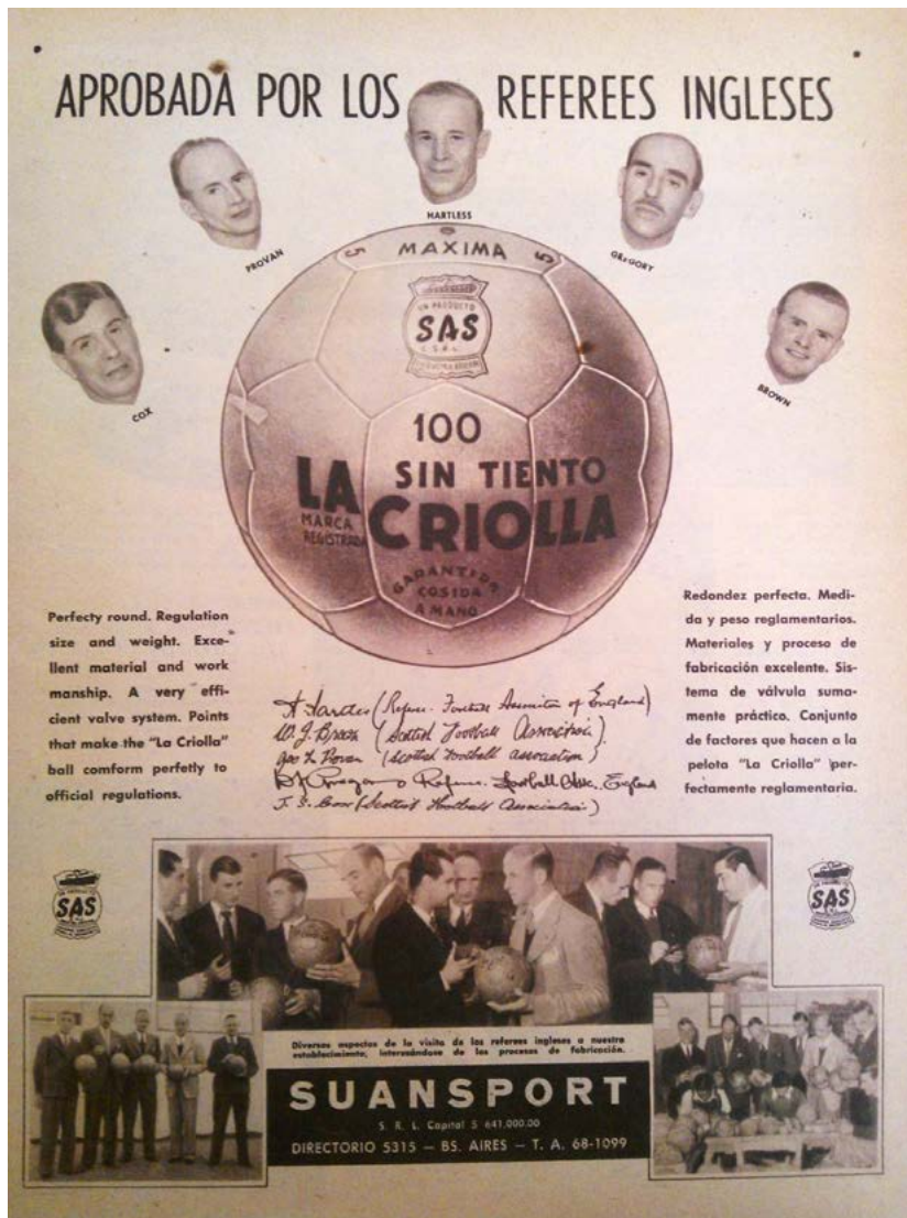
Imagen 1. El Gráfico , 7 de mayo de 1948

Si bien algunos de los visitantes regresarían al año siguiente a su país, la mayoría fue reemplazado por otros de similar procedencia. 33 Los registros de la AFA muestran que durante varios años los partidos de la primera división siguieron siendo arbitrados por jueces importados hasta bien entrada la década siguiente, aunque ya no en exclusividad, ya que fueron alternando los partidos de primera división con jueces locales. En 1958, al finalizar sus contratos, los últimos árbitros ingleses dejaron la Argentina (con la excepción de Robert Turner, quien se radicó en nuestro país).