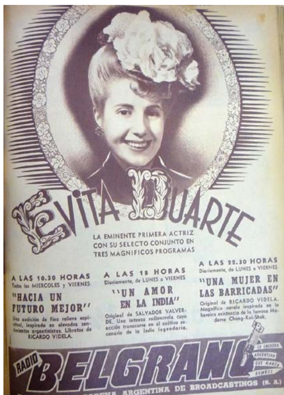
Imagen 1. Radiolandia , año XIX, nº 896, 18 de mayo de 1945